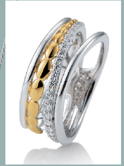
4225696 Ring Silber rhodiniert mit Zirkonia € 139.-