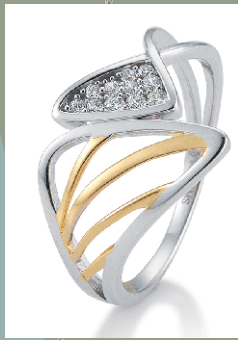
42259170 Ring Silber rhodiniert mit Zirkonia € 99.-