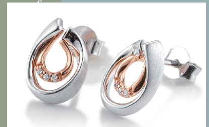
02235140 Ohrschmuck Silber rhodiniert mit Zirkonia € 99.-