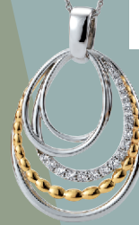
3225695 Anhänger (ohne Kette) Silber rhodiniert mit Zirkonia € 129.-

Es müssen nicht immer die großen, bekannten Marken sein, manchmal sind die kleineren, unbekannteren Hersteller äußerst innovativ! Uns gefällt der Schmuck jedenfalls außergewöhnlich gut!