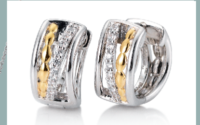
06256940 Ohrschmuck Silber rhodiniert mit Zirkonia € 159.-