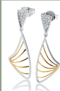
12259180 Ohrschmuck Silber rhodiniert mit Zirkonia € 119.-