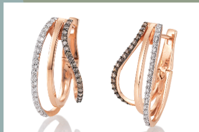
06258170 Ohrschmuck 585/- Rot- bzw. Weißgold 40 Brillanten 0,20 ct w/si, 36 Brillanten chocolate 0,18 ct braun/si € 1399.-